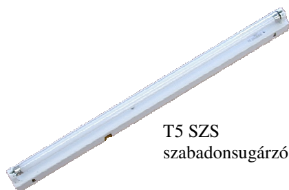
T5 SZS szabadonsugárzó