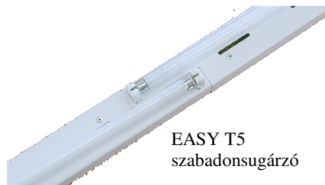
EASY T5 szabadonsugárzó