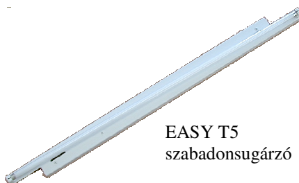
EASY T5 szabadonsugárzó